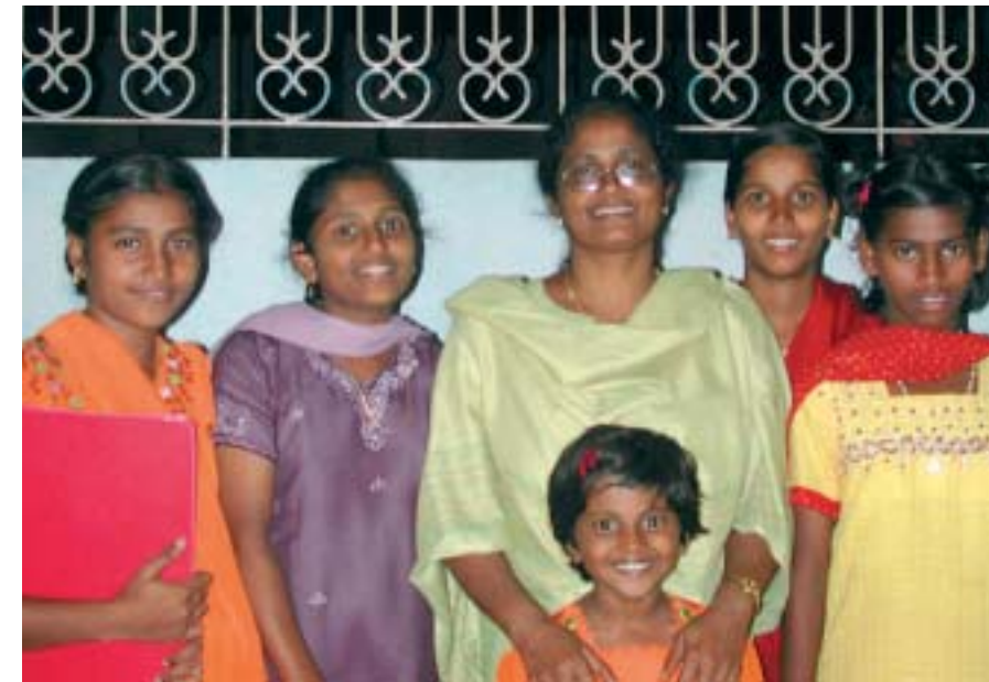
Sie haben besondere Förderung nötig: Mädchen in einem Heim der südindischen Kirche.