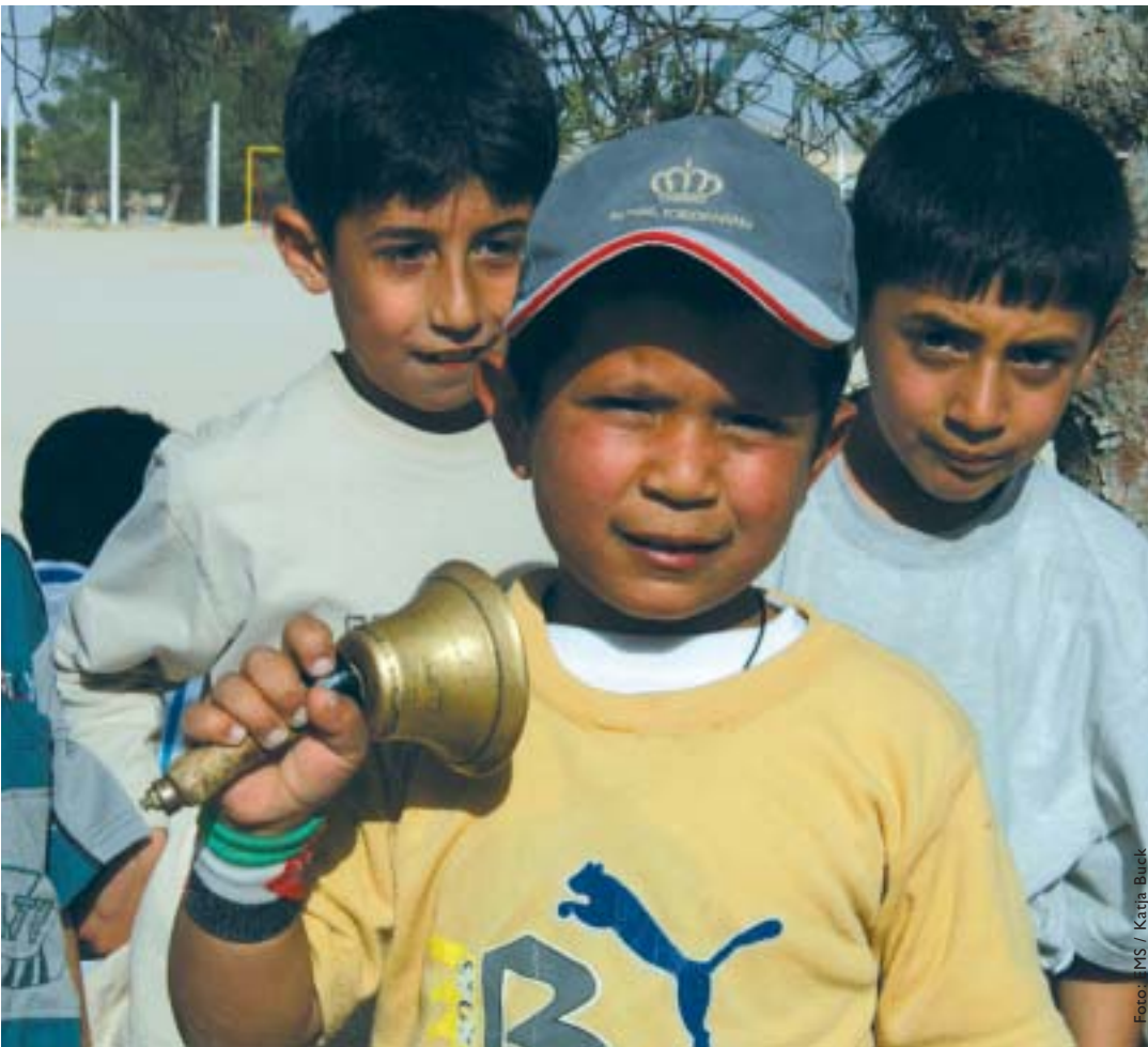
Wollen Sie zu einem besonderen Anlass für das EMS spenden? Die Schneller-Schule im Libanon ist nur eines von vielen Projekten, die wir Ihnen empfehlen können.

Die Grundidee ist, dass bei besonderen Anlässen anstelle von Geschenken um Spenden gebeten wird. Das Geburtstagskind oder die Jubilarin beziehungsweise der Jubilar hilft mit dem Verzicht Menschen in Not und schenkt Hilfe und Hoffnung. Vielleicht gilt hier das Sprichwort „Freude, die wir geben, kehrt ins eigene Herz zurück“ auf besondere Weise. Gleichzeitig können die Gäste und die Gratulanten sicher sein, dass sie das passende Geschenk gewählt haben. Denn wir alle kennen die bohrende Frage: „Was schenke ich nur?“