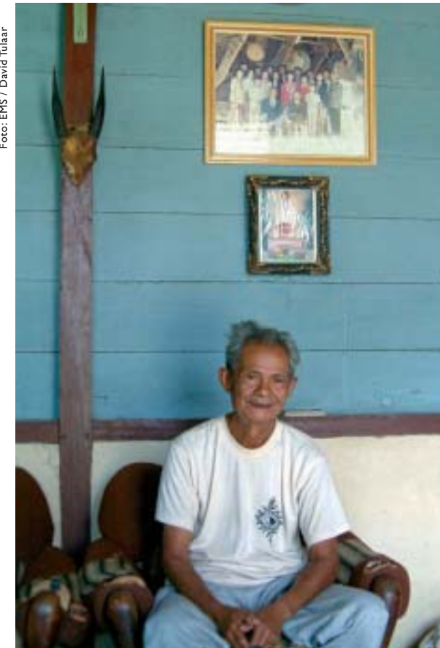
Indonesier in Mamasa, der stolz unter dem Foto seiner siebzehn Kinder sitzt.

Das Wort „alt“ kann aber auch einen besonderen Glanz verleihen. Oft sind es unsere Enkelkinder, die uns beide Schattierungen des Wortes bewusst machen. Im Vergleich mit den wuseligen Energiebündeln spüren wir das eigene Abnehmen schmerzlich. Aber wir sind interessant für sie. Wir wissen, wie es früher war. Sie hören gespannt zu, wenn wir erzählen. Wie es war, als es nur ganz wenige Autos gab. Aber auch von der Hitlerzeit, vom Krieg und den Bombennächten, von den Kuhrüben, die wir nach dem Krieg aßen. Und vom Wiederaufbau mit Ziegelsteinen aus den Ruinen.