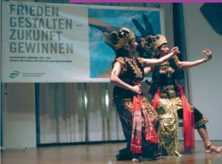
Internationales buntes Treiben auf dem EMS-Fest in Mainz

links: indonesische Tänzerinnen, unten: Information über die zahlreichen EMS-Aktivitäten