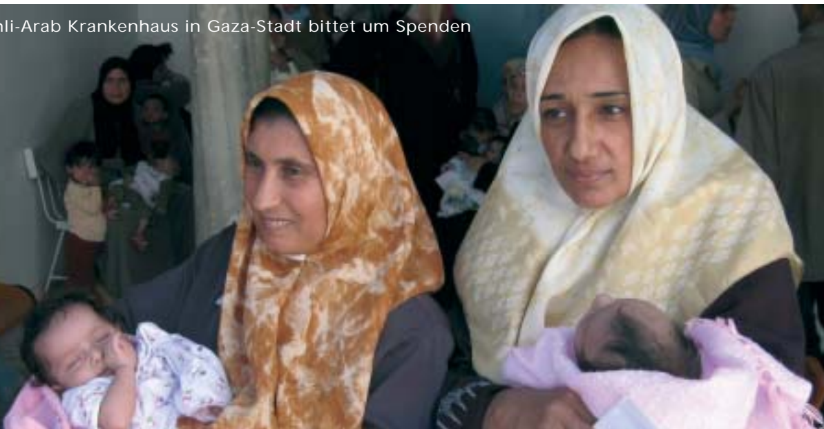
Zwei Frauen mit ihren Säuglingen holen sich im Ahli-Arab-Hospital ärztlichen Rat.

Die gewalttätigen Auseinandersetzungen zwischen Palästinensermilizien im Gazastreifen vor einigen Wochen waren vorhersehbar. So hatte beispielsweise die UN-Organisation Ocha bereits im April 2006 gewarnt: Sollte nämlich die EU ihre Zahlungen an die Palästinenserbehörde einstellen und sollte die israelische Regierung die den Palästinensern zustehenden Steuern einbehalten, könnten die palästinensischen Polizisten nicht mehr bezahlt werden. Die Palästinenserbehörde würde folglich die Kontrolle über sie verlieren. Die Wirtschaft werde zusammenbrechen und drei Viertel der Bevölkerung würden bald in Armut leben. Der Mittelstopp würde sich auch hart auf den öffentlichen Dienst-