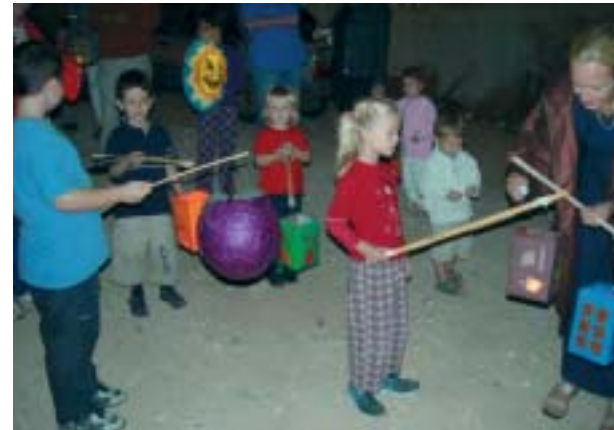
oben: Kinder beim Laternenumzug zu St. Martin rechts: die Gemeinde beim Ausflug

Damals war der gesellschaftliche Druck noch nicht so groß. Der Einfluss der islamistischen Strömungen löst viele Ängste aus. Heute wird propagiert, es gebe nur einen einzigen Weg zum Seelenheil: den Weg mit dem Propheten Mohammed. Und deswegen wisse man auch genau, wie man sich zu verhalten habe auf diesem Lebensweg. Wer davon abweiche, sei verloren. Geraten die Ehemänner unter diesen Einfluss, gibt es Probleme. Nicht selten kommt es zu Ehescheidungen, die Kinder werden den Frauen entzogen, weil sie die Kinder nicht wirklich moslemisch erziehen könnten.