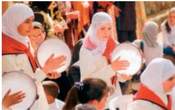
Palästinensische Kultur bewahren

ausstellung zusammenstellte, die bei der deutschen Sektion von Pax Christi ausgeliehen werden kann, fand er palästinensische Organisationen in Bethlehem und Umgebung, die sich für die Bewahrung der palästinensischen Kultur einsetzen. Begeistert über das florierende Kythera-Netz machten sie sich ein solches Vorhaben für Palästina zu Eigen.