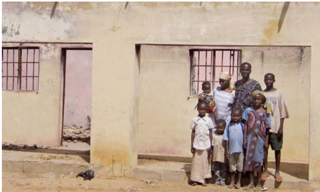
Eine Familie vor ihrem zerstörten Haus