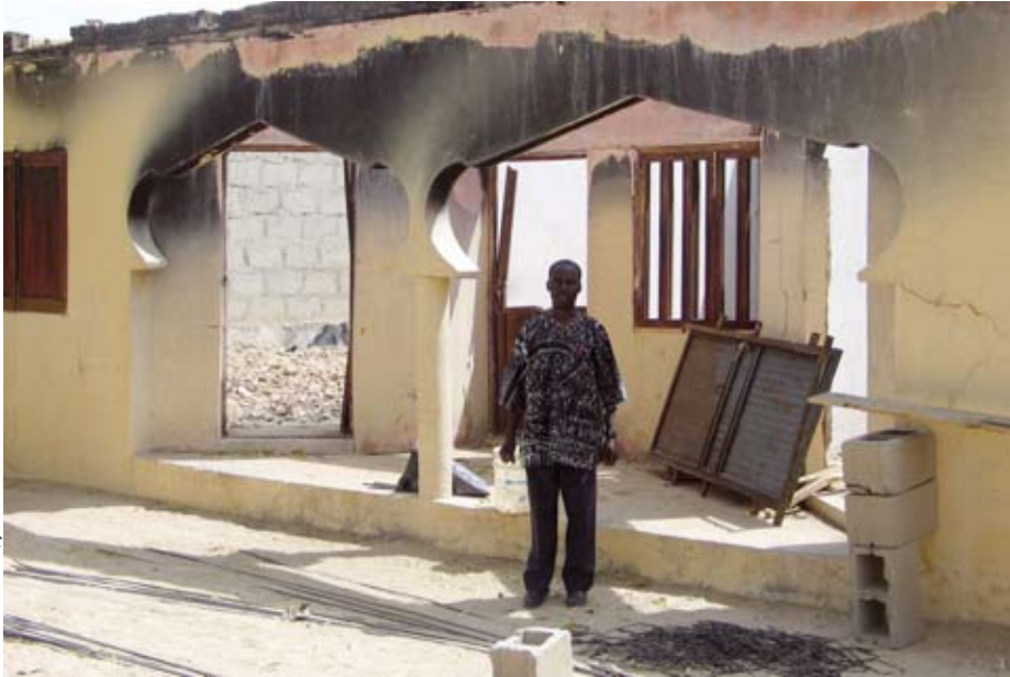
Kirche in Maiduguri, die am 18.2.06 zerstört wurde

und eine Moschee stehen, aber es war nicht klar, was brannte. Das Feuer war riesig. Immer wieder waren Schüsse zu hören. Erste Flüchtlinge aus dem Norden der Stadt trafen bei uns ein.