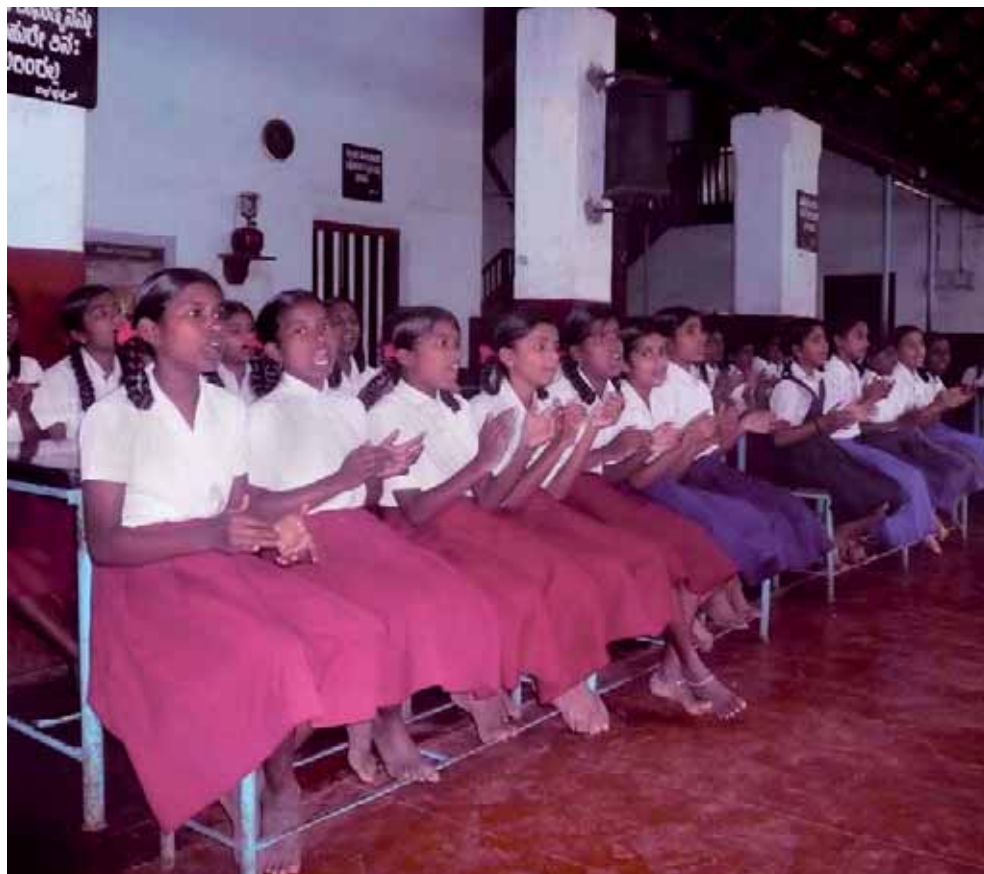
Mädchenheim Mulki, Karnataka/Indien

Durch unsere gemeinsame tatkräftige Hilfe können wir an diesem konkreten Ort, für diese speziellen Kinder so viel Gutes und Hilfreiches bewirken. ●