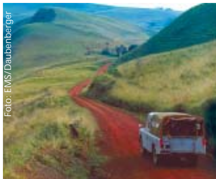
Kamerun wird „Afrika im Kleinen“ genannt.

mission 21/Basler Mission betreibt in Kamerun gemeinsam mit der Presby-