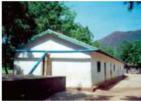
Das Schuldach mit dem neuen Regenrinnensystem

Es war ein großes Fest, als vor vier Jahren zum ersten Mal ein Kirchenkreis der EYN (Geschwisterkirche) in Nigeria eine eigene Grundschule einweihte. Tausende aus der Umgebung und die gesamte Kirchenleitung kamen und freuten sich, dass nun auch in diesem entlegenen Tal in den Mandara-Bergen eine Bildungsmöglichkeit für die Kinder geschaffen werden konnte. Eltern, Lehrer und Kinder haben die Schulgebäude zum Teil selbst mit errichtet.