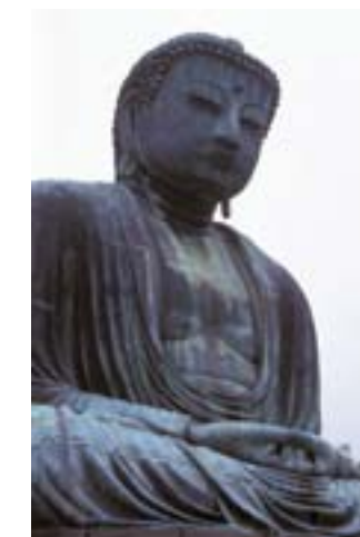
Buddha Statue, Kamakura/Japan

17. bis 19. Februar 2010 (Mi.-Fr.) Tagungsnummer: 103131